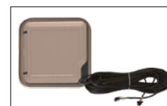
Kit de montaje a pared de 20 m (en opción) - HWX29400053