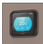
Pantalla táctil LED